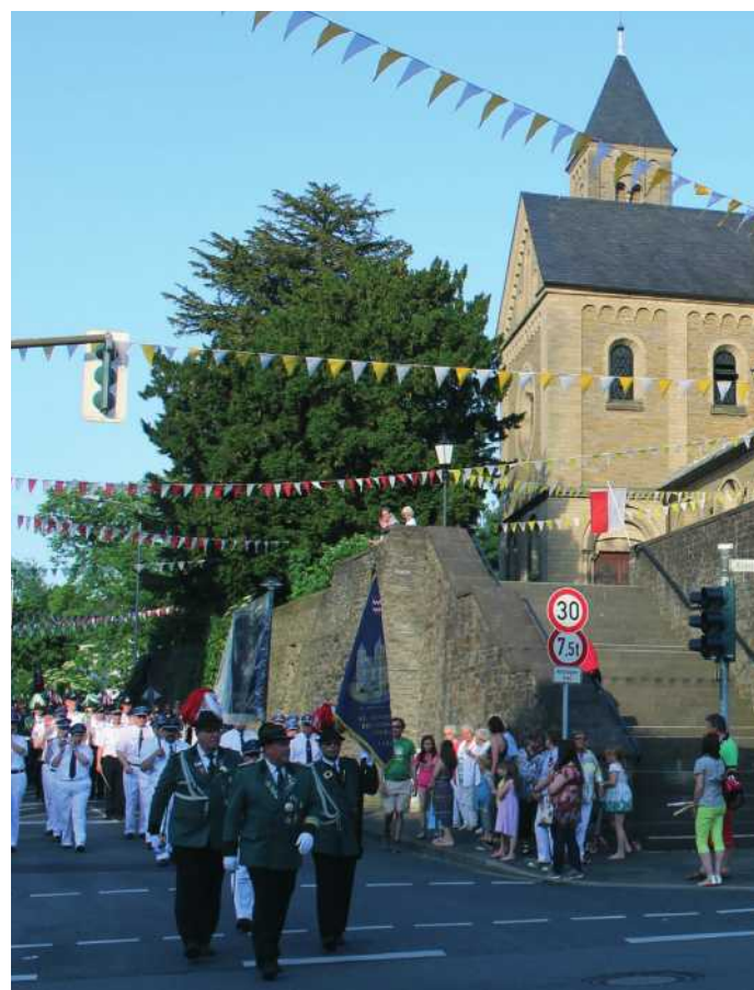
Großer Festumzug durch die Straßen Erkraths, hier vor der katholischen Kirche St. Johannes der Täufer

Wenn auch Sie Lust auf einen schönen Abend mit Tanzmusik haben, kommen Sie doch vorbei. Der Eintritt ist kostenfrei.