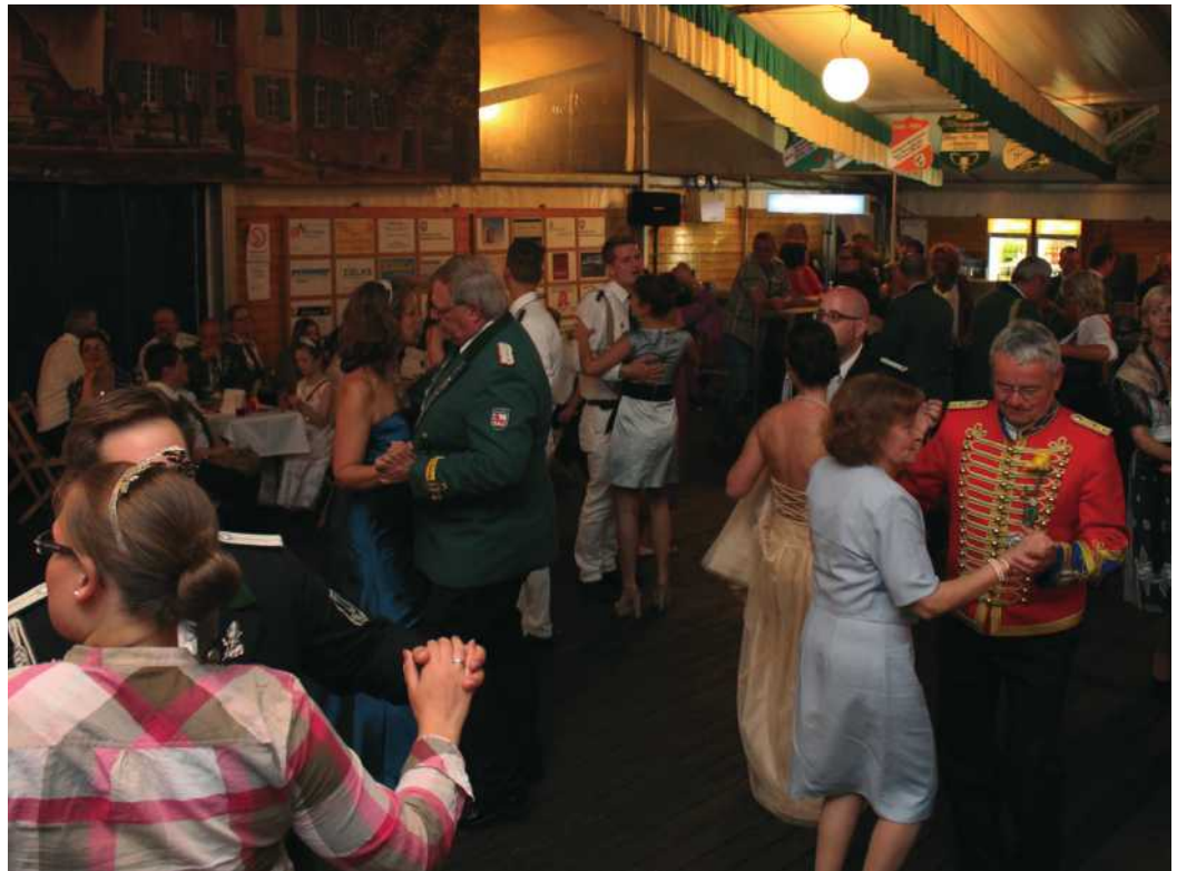
Der Krönungsball im Festzelt

Am Samstag feiert die Bruderschaft mit Ihnen den festlichsten Abend des Schützen- und Volksfestes: Den Krönungsball. Neben der Verabschiedung der alten Königs- und Prinzenpaare steht die Krönung der neuen Majestäten im Vordergrund. Viele befreundete Vereine, aber auch viele Erkratherinnen und Erkrather, sind dabei um zu gratulieren, zu feiern, zu tanzen und viel Spaß zu haben.