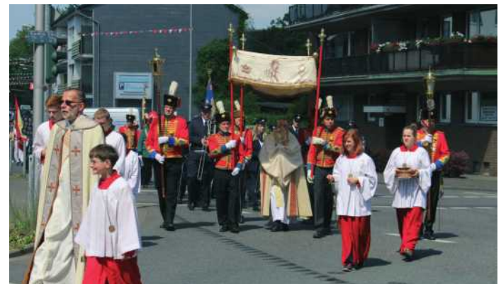
Fronleichnamprozession in Erkrath

bruderschaft ggst. erlaubt habem, am nächstkünftigen fronleichnamstag die procehsion, jedoch ohne schießen und trommeln, auch mit Vermeidung aller Unordnung, zu begleiten, so wird es Euch zur Nachricht uns weiters nötiger Verfügung gnädigst unverhalten. Carl Theodor, ...“