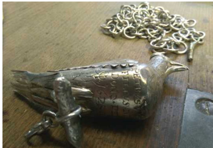
Taubenkette der Bruderschaft von 1623 in der Goldschmiedewerkstatt

Da die Taube eine große Bedeutung für die Bruderschaft hat und über die letzten knapp 400 Jahre durch den regelmäßigen Tragegebrauch deutlich gelitten hat, beauftragte die Bruderschaft die Anfertigung eines Replikats, das