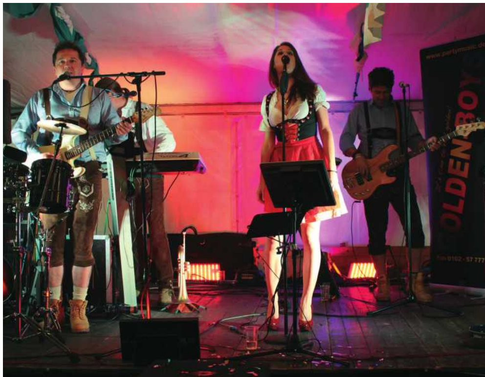
Die Band „Goldene Buam“ sorgt für einen zünftigen bayrischen Abend im Erkrather Schützenzelt

Einen Dresscode für den Abend gibt es nicht. Die Sebastianer werden ihre Uniformen tragen, die Damen des Vereins überwiegend ein Dirndl. Unsere Gäste sind herzlich eingeladen, ebenfalls in einer zünftigen bayrischen Tracht zu kommen. Dies gilt insbesondere für die männlichen Gäste des Abends, da es einige rustikale Events wie Baumstammsägen, „Kuh“ melken und Bierkrugstemmen gibt. Feiern Sie mit und haben Sie Spaß.