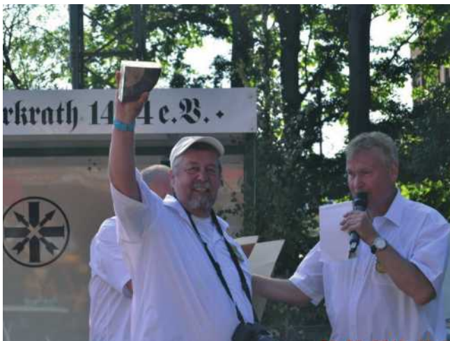
Die Große Erkrather Karnevalsgesellschaft auf dem Hochstand der Bruderschaft