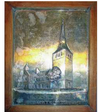
Silberplakette zum Oberst-Jüntgen-Gedächtnispreis