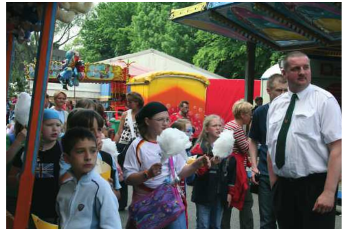
Kinder auf dem Schützen- und Volksfest

Um das Interesse der Bevölkerung und insbesondere der Kinder und Jugendlichen am Schützen- und Volksfest zu fördern, wurde die alte Tradition vor einigen Jahren wieder aufgenommen. Einige Wochen vor dem Schützenfest verteilt die Bruderschaft Gutscheine in den Grundschulen, die