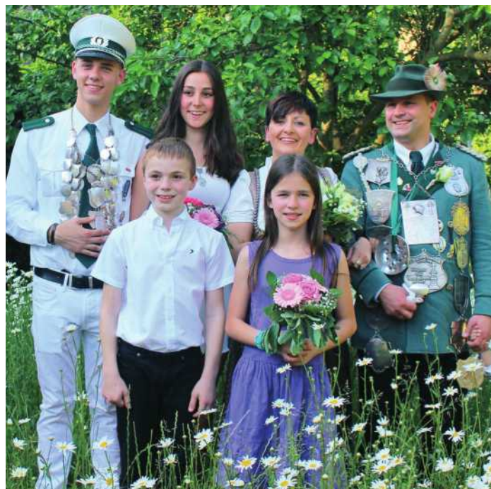
Majestäten der St. Sebastianus Bruderschaft 2015 / 2016 im Garten von Pastor Ernst

Wer hätte das gedacht - es fällt ein Schuss und plötzlich steht man im Rampenlicht! Egal ob man sich hierauf vorbereitet hatte und einen großen Wunsch erfüllte oder unvermittelt und spontan den entscheidenden Schuss abgegeben hat: Man ist im ersten Moment aufgewühlt und etwas überfordert. Schnell wird man dann jedoch von einer starken Gemeinschaft aufgefangen und im wahrsten Sinne des Wortes von ihr „getragen“.