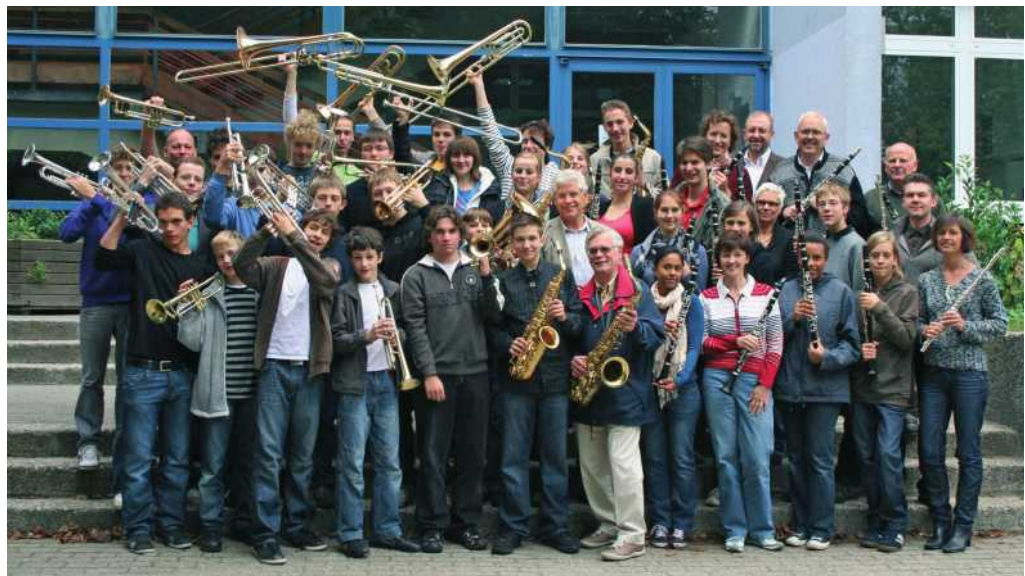
Die Jugendmusikschule Erkrath begeistert seit Jahren die Zuhörer im Festzelt

Die Jugendmusikschule Erkrath freut sich auf dem diesjährigen Schützenfest am Sonntag ab 12.30 Uhr das Publikum mit ihrem aktuellen Programm zu unterhalten.