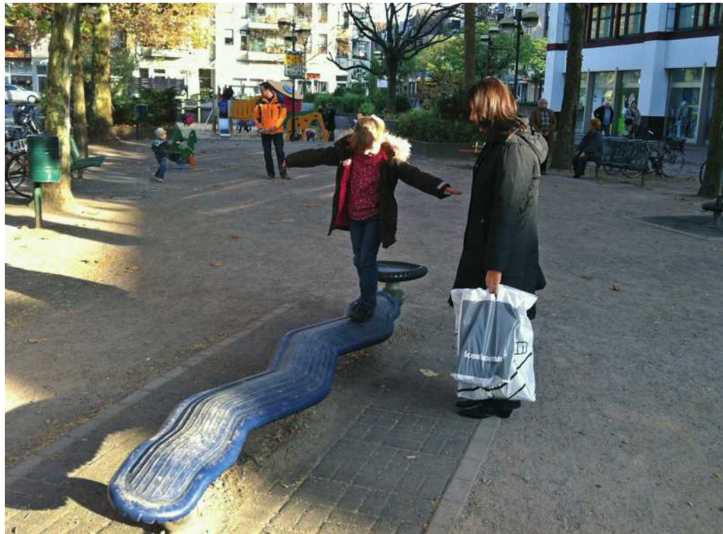
Spielgeräte für die Fußgängerzone - hier ein Symbolbild

gute Voraussetzungen, um entspannt einkaufen zu können. Mit der Entspannung ist es aber für viele Eltern und Großeltern oftmals vorbei, wenn sie mit den Kindern oder Enkeln einkaufen wollen. Die Kleinen haben selten Lust hierzu; ein wirklicher Anreiz fehlt. Um auch für junge Familien mit kleinen Kindern einen Besuch der Bahnstraße interessanter zu machen, hatte das Königspaar 2015 / 2016 der Sankt Sebastianus Bruderschaft 1484 Erkrath e.V., Dirk und Tina Hanten, eine Idee: Durch die Aufstellung von Spielgeräten müssen Kinder nicht mehr nur fernab der Bahnstraße auf Spielplätze gehen, wenn sie wippen, klettern oder schaukeln wollen. Diese Möglichkeiten sollen auch auf der Bahnstraße geschaffen werden, um dort mehr Leben hinzubringen und sie für alle Erkratherinnen und Erkrather als Einkaufs-