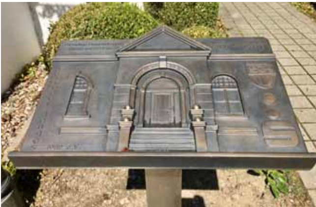
Gedenktafel vor dem Rathaus, wo sich die ehemalige Gemeindeparkasse von 1913 bis 1957 befand. Gestiftet von den Ercroder Jonges mit Unterstützung der Kreissparkasse Düsseldorf.

Wir wünschen ein frohes und friedliches Schützen- und Volksfest 2017.