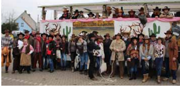
Die Karnevalstruppe der Erkrather Bruderschaft und ihr Wagen bei dem Umzug in Erkrath

Gemeinsam mit unseren befreundeten Vereinen feiern wir Karneval oder beteiligen uns an dem Erntedankfest. Eine lange