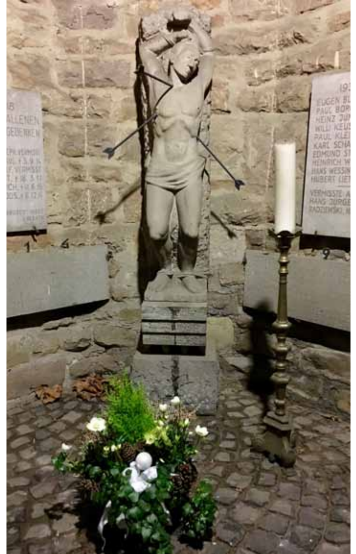
Gedenkstatue des heiligen Sebastian an der Pfarrkirche Sankt Johannes der Täufer; Sebastian wurde aufgrund seines christlichen Glaubens und seines Eintretens für die christlichen Werte im dritten Jahrhundert getötet

Keine Regelungen gibt es in der Erkrather Satzung für geschie-