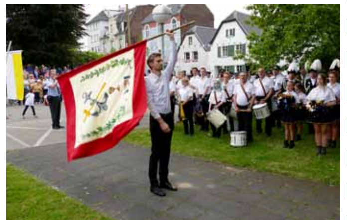
Historisches Fahnschwenken bei der Proklamation

Im Anschluss an das Fahnschwenken wird für die scheidenden Majestäten der große Zapfenstreich gespielt. Es folgt der Ruf zum Gebet und im Anschluss hieran die Deutsche Nationalhymne. Hiernach machen sich die Schützen zu dem großen Umzug durch Er-