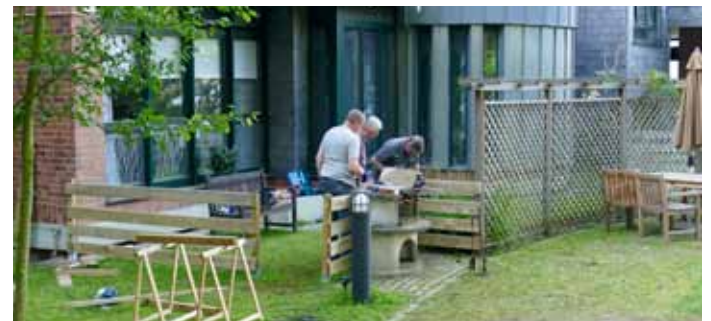
Mitglieder der 1. Kompanie richten einen Zaun für das CBT-Haus her

Die Erkrather Bruderschaft wurde 33 Jahre vor der Reformation gegründet und steht, nunmehr als gemeinnütziger kirchlicher Verein, der katholischen Kirche an der Seite. Sie engagiert sich in ihrer Erkrather Heimat beispielsweise für den Erhalt und die Pflege des Heiligenhäuschens, unterstützt die Kirche bei der Herstellung der Beleuchtung der Kirche oder spendet für