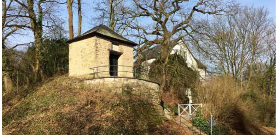
Das Heilighäuschen am Korresberg in Erkrath (2016)