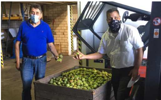
Mitglieder der Bruderschaft mit der 2020er Ernte der Birnenallee

Für dieses Projekt sind bereits erste Spendengelder eingegangen – weitere Unterstützung ist aber jederzeit willkommen !