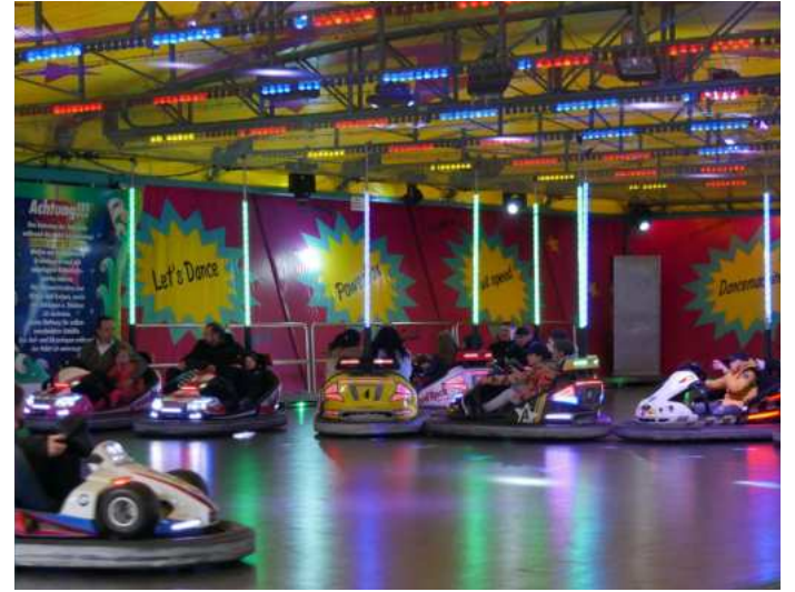
Fahrgeschäft auf der Herbstkirmes auf dem Gerberplatz

Im September 2021 hatte der Festausschuss der Bruderschaft beschlossen, vom 21. bis 24. Oktober 2021 eine Kirmes und mehrere Benefizschießen zugunsten der vom Hochwasser Betroffenen zu veranstalten. In nur gut vier Wochen konnte eine große Anzahl an Schaustellern für das Fest gewonnen werden. Sie sagten gerne zu, denn auch sie hatten durch