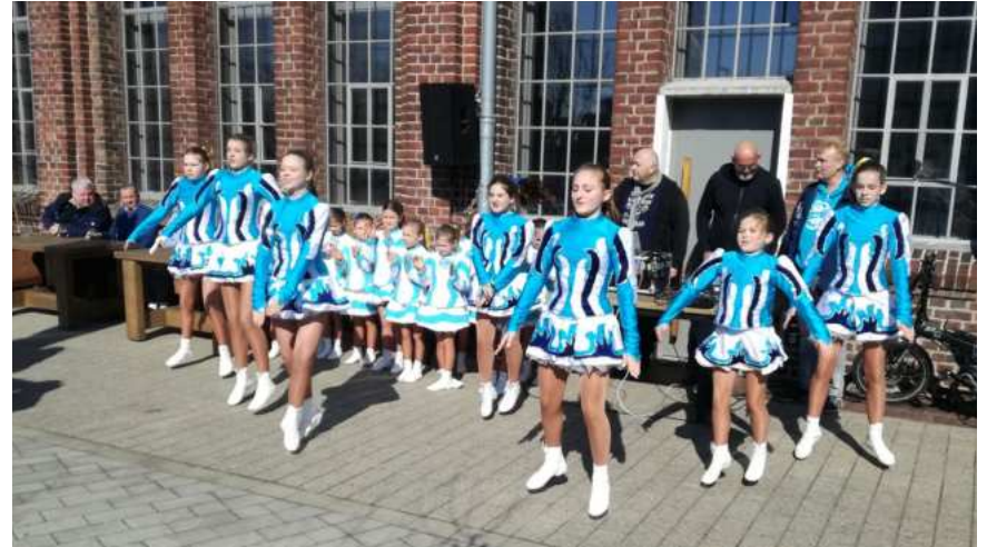
Ukraine Benefizfrühsschoppen 2022 - Vorführung der Hoppedötze

Erkrath organisiert. Mit viel Energie einer kleinen Gruppe der Bruderschaft und anderen freiwilligen Helfern wurde dieser Frühsschoppen durchgeführt. Das war ein voller Erfolg. Von Anfang an waren Tische und Bänke belegt und erst bei Einbruch der Dunkelheit fand die Veranstaltung ein Ende. Nahezu alle Waren die für diesen Frühsschoppen benötigt wurden, wurden von der Brauerei Krombacher, der Brauerei Bolten, der Metzgerei Hanten, der Bäckerei Evertzberg, dem Brauhaus zum goldenen Handwerk, Getränke Moosig und vielen anderen gespendet. Auch die Große Erkrather KG hatte mit Vorführungen der Hoppe-dötze zum Erfolg des Tages beigetragen. Im Ergebnis