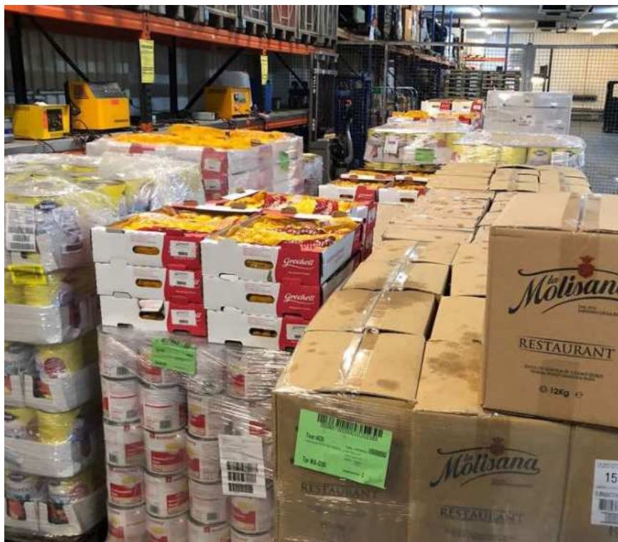
Paletten mit gekauften und gespendeten Lebensmitteln für Tschernihiv / Ukraine

Von diesem Geld kaufte die Bruderschaft Lebensmittel für Chernihiv und ließ diese an die Polnisch-Ukrainische Grenze liefern, wo sie von Transportern aus Chernihiv abgeholt wurden. Die Organisatoren hoffen, das damit das Leid der Menschen in der Ukraine ein wenig gelindert und Ihnen ein Lichtblick in Kriegszeiten gegeben werden konnte, um diese schweren Zeiten länger durchzuhalten.