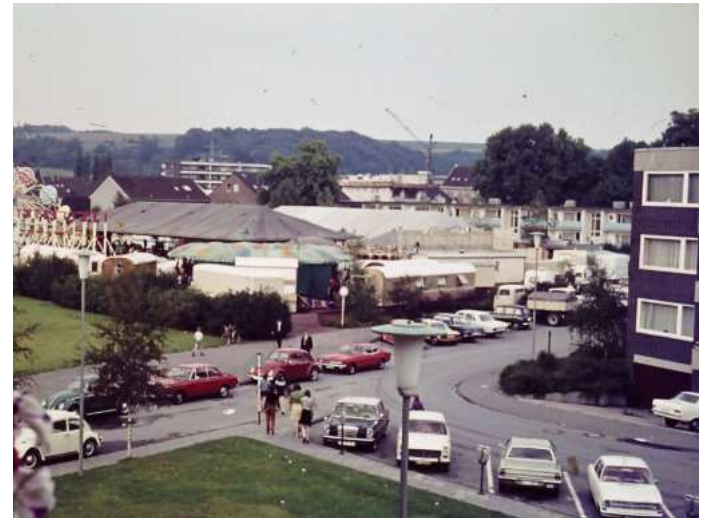
Roter Platz mit Kirmes, um 1965

Ab dem Jahr 1824 sind im „Adreß-Kalender und Taschenbuch für Geschäftsleute im Regierungs-Bezirk Düsseldorf 1824“ zwei Jahrmärkte in Erkrath nachgewiesen: „1) Fronleichnam und 2) am 1. Sonntag vor oder nach Johanni Enthauptung, das ist der 29. August“. Zum letzten Termin veranstaltete nach der Gründung 1893 der Erkrather Bürgerschützenverein sein Schützenfest mit Kirmes, einigen Älteren noch als „Speckbirnenkirmes“ bekannt. Die seit 1482 bestehende Sebastianus-Bruderschaft hielt ihr traditionelles Vogelschießen immer am Fronleichnamstag ab. Es fehlen bedauerlicherweise Nachweise dafür, ob es im späten 15. Jahrhundert bereits