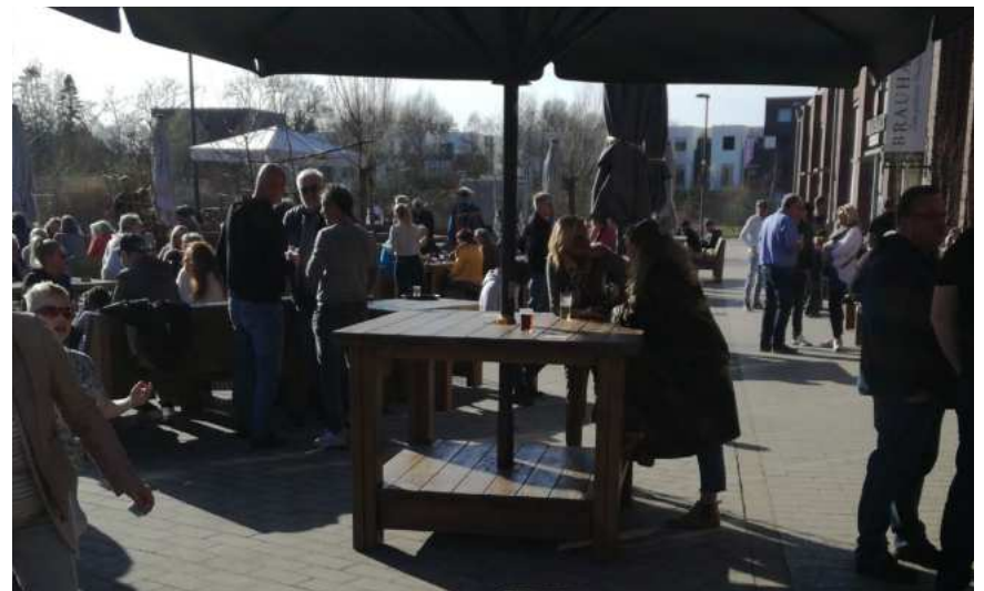
Ukraine Benefizfrühsschoppen 2022