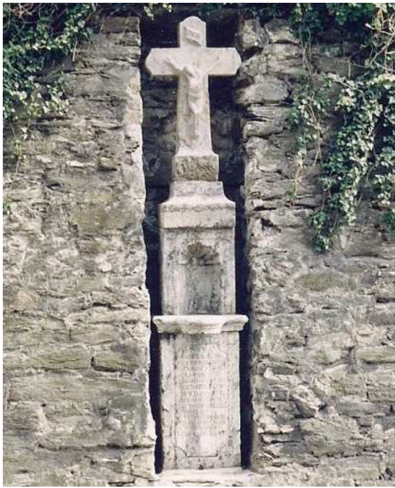
Wegkreuz in der Mauernische an der Kirchstraße