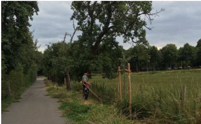
Pflegearbeiten an den jungen Bäumen

gemeinsam mit der Biologischen Station Haus Bürgel an der 'Birnenallee' bei Haus Morp.