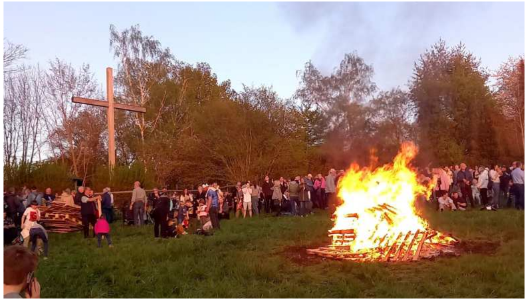
Osterfeuer 2022 am Eickener Busch bei schönstem Wetter und mit vielen Besuchern

Für die Bruderschaft war es der erste Schritt in der aktuellen Phase der Pandemie zurück in die neue Normalität. Alle Gäste haben das Fest genossen.