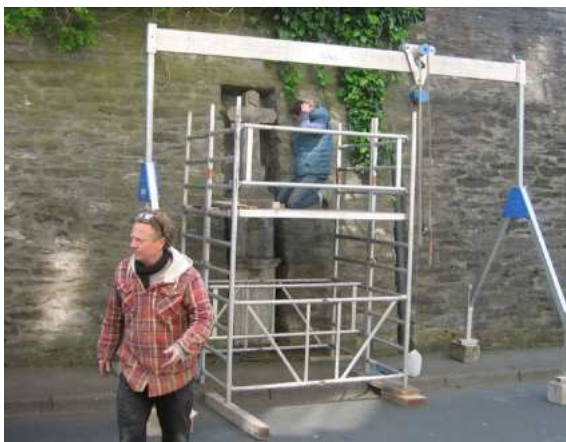
Demontage im Mai 2022

Nur, woher kommt die Bezeichnung „Kreuzstraße“? Die historisch wohl korrekte Antwort lautet, daß bis 1954 ein Wegkreuz am damaligen Treppenaufgang zur kath. Kirche St. Johannes der Täufer stand und wohl namensgebend „verantwortlich“ war. Dieser Treppenaufgang musste erneuert werden und so wurde das Kreuz von seinem ursprünglichen Platz in eine Mauernische zur Kirchstraße versetzt.