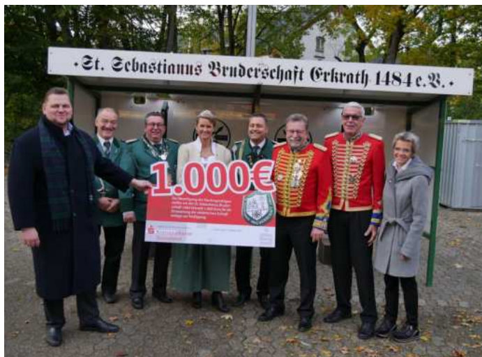
Übergabe eines symbolischen Checks durch einen Vertreter der Kreissparkasse Düsseldorf an das amtierende Königspaar

erzielt werden. Davon konnten 4.500 € an „Erkrath hält zusammen“ weitergegeben werden, die schon im Juli 1.000 € als Soforthilfe von der St. Sebastianus Bruderschaft erhielten. Weitere 1.000 € gingen an den Dachverband „Bund der Historischen Deutschen Schützenbruderschaft e.V.“, der durch Sammlungen in den Mitgliedsbruderschaften die Flutopfer in Nordrhein-Westfalen und Rheinland-Pfalz unterstützt.