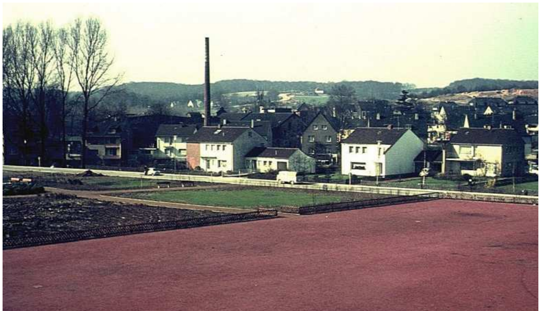
„Roter Platz“ ohne Kirmes, mit Blick Richtung Bongardstraße, heute Standort des Bavier Centers um 1965