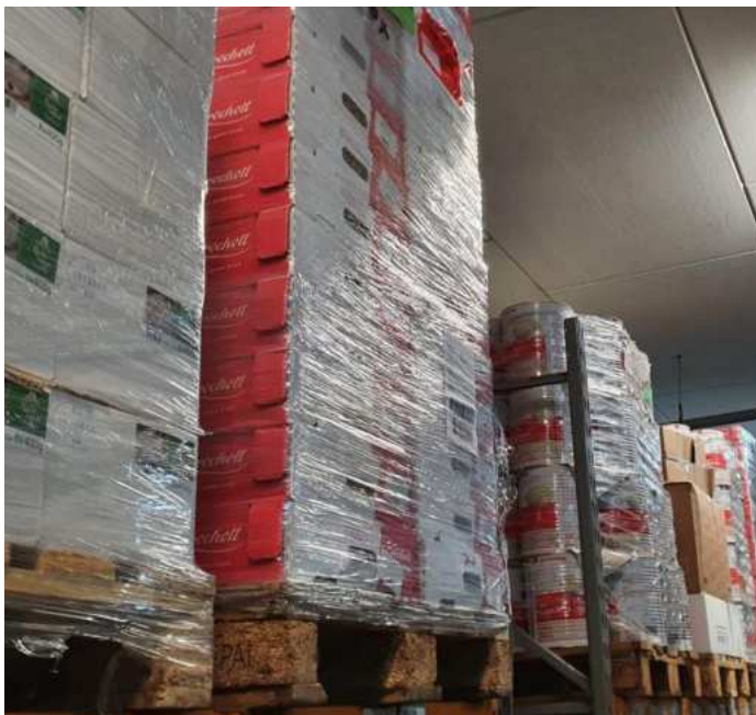
Paletten mit gespendeten Lebensmitteln für Tschernihiv / Ukraine

Die vielen kleinen und großen Katastrophen an der Düssel, in Deutschland, in Europa und in der Welt belasten Körper und Seele. Helfen wo man kann, für die Mitmenschen und die, die in Not geraten sind. Das sind Selbstverständlichkeiten, die für alle Menschen gelten sollten. Insbesondere für eine christlich geprägte Bruderschaft. Und so war die Sankt Sebastianus Bruderschaft Erkrath auch ohne