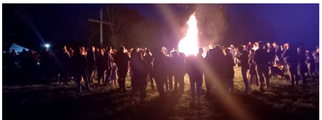
Osterfeuer 2022 zur späteren Stunde