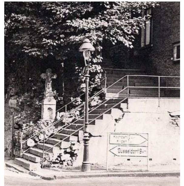
Wegkreuz an der Kreuzstraße, 1948

Allen, die mitgeholfen haben dieses Projekt zu ermöglichen, gilt unser aufrichtiger Dank !